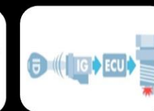
Inmovilizador de motor