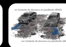
Sistema de arranque en Descenso (DAC)