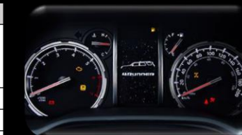
Panel de instrumentos Optitrón