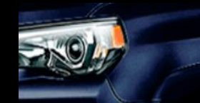
Azul Oscuro Mica