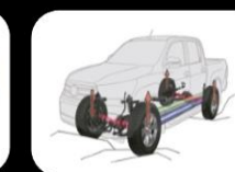
Control de tracción Activo (A-TRAC)