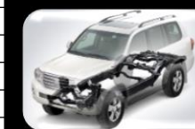
Estructura de carrocería (GOA)