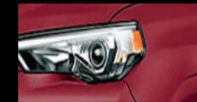
Rojo Mica Metálico