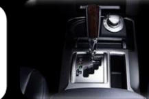
Automático 5 velocidades