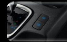
Modo ECO Versión AT