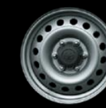
Rines 17 acero Versión MT