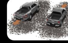
Sistema de arranque en pendientes (HAC)