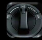
Swich de 4x4