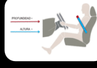
Columna de dirección Colapsable