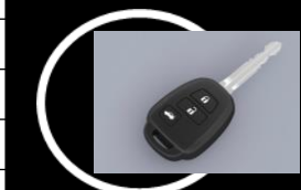
Llave de encendido