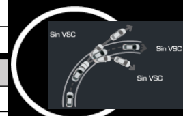
Control de estabilidad VSC