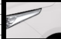
Súper Blanco II