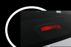
Tercera luz de freno