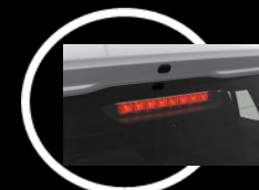
Tercera luz de freno