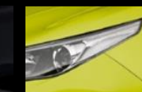
Verde Mica Metálico