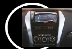
Cámara de reversa