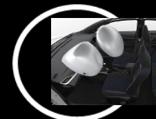
Air bag frontales