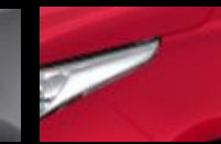
Rojo Mica Metálico