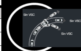
Control de estabilidad VSC