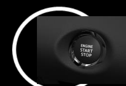
Encendido con botón Versión HG