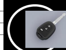
Llave de encendido Versión STD