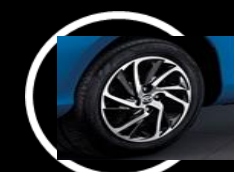
Rines 15 de aluminio