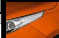
Anaranjado Mica Metálico