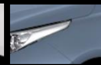
Azul Grisáceo Metálico